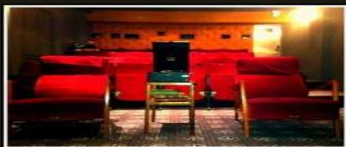
Bergmans gamla Visningssalong, Operan

- Guide från Filmstadens kultur möter upp hos oss i Regissörsvillan för att sedan ta den korta promenaden till Biografen, här sker en kort introduktion. Filmen är 57 minuter lång, därefter en kort rundtur i området. Total tid 1,5 tim. Salongen tar emot maximalt 24 personer. Kanske att ni önskar Biogodis såsom Popcorn!